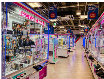
クレーンゲーム中心のレイアウト