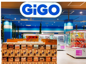
カプセルおもちゃ充実

駅近のショッピングモール『ゆめタウン飯塚』に出店。未来のアソビを提案するインドアプレイグラウンド『リトルプラネット』を併設したファミリーターゲットの店舗。