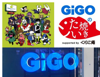
3Dのサインや様々なコンテンツ