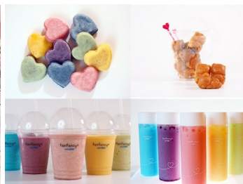
オリジナルスイーツ&ドリンク