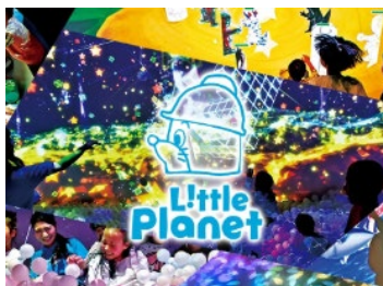
リトルプラネット