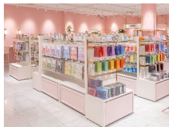
ファンシーピンクで統一した店内

原宿竹下通りにオープンした推し活ショップ。推しのカラーに合わせたコーディネートが楽しめるグッズやカラーをテーマにしたオリジナルスイーツ&ドリンクを提供。