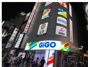
ブランドデザインを採用した外観

渋谷宇田川町交番目の前。『GiGOのたい焼き』や『Fangamer Japan』の物販コーナー、衣装レンタル併設のプリコーナー、バスケットボールコンセプトのウォールアートなど、渋谷系のコンテンツ満載。