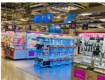
メインエントランス

『京都河原町駅』3番出口から徒歩1分の『河原町オーパ』7Fに出店。明るく開放的な店内でファミリー層に人気。国内外の観光客で活況を呈す京都に3店舗目のGiGOです。