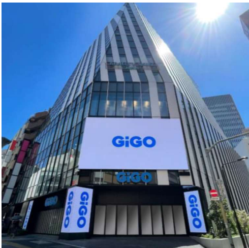
デジタルサイネージ&メインエントランス

店内2階には創業130年の『金井大道具』による歌舞伎の舞台美術「松羽目」が国立劇場と同じサイズで忠実に再現されており、その圧倒的な存在感と、筆の質感まで感じられる再現性で、普段は立つことのできない舞台を体験することができます。外観に設置した6面のデジタルサイネージはそれぞれが連動することでサンシャイン60通りに新しいビジュアルエンターテインメントを提供しています。