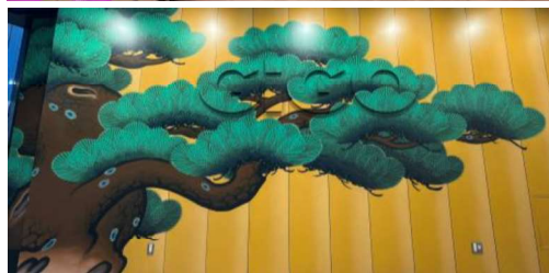
協力:独立行政法人日本芸術文化振興会(国立劇場)