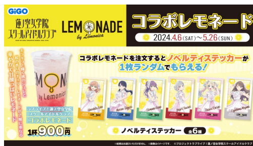
開催中のコラボキャンペーン