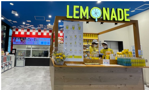
GiGO総本店にオープンしたLEMONADE by Lemonica

「GiGO総本店」に当社のグループ企業である株式会社レモネード・レモニカが運営するスタンド型レモネード専門店「LEMONADE by Lemonica」が4月1日(月)にオープンしました。「GiGO総本店」はその広さから店内を回遊するお客さまも多く、2階に出店した「LEMONADE by Lemonica」はゲームの合間の休憩や待ち合わせ、お客さま同士獲得した景品を見せ合うなど、新しいコミュニケーションスポットとしてすでに人気になっています。また、4月6日(土)から国内に約50店舗ある「LEMONADE by Lemonica」の店舗で「ラブライブ！蓮ノ空女学院スクールアイドルクラブ」コラボを開催中で、「GiGO総本店」にもコラボ・レモネードを求めるお客さまが多く来店しています。益々気温も高くなりサンシャイン60通りで「LEMONADE by Lemonica」のPOPなカップを目にする機会も多くなっています。