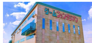
ゲームファンタジアン