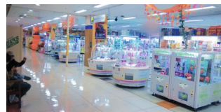
スマイルステーション