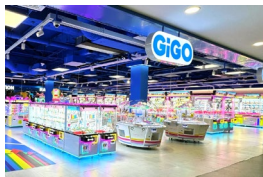
5. GiGO Vincom Plaza 3 Thang 2