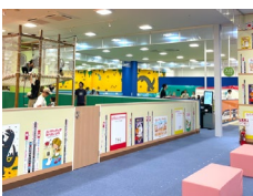
2. FUN VILLAGE in URAWAMISONO

28日、日本発の推し活専門ショップ「fanfancy+ with GiGO」が、池袋、原宿、大阪に続き、台湾の「遠東ガーデンシティ」にオープンしました。台北ドームに隣接するこの店舗では、台北限定アイテムやミニチュア撮影スポット、「おなまえカスタム」シリーズなどが人気で、日本発の最新推し活グッズが多くのお客さまに支持されています。