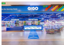
5. GiGO Vincom Mega Mall Grand Park