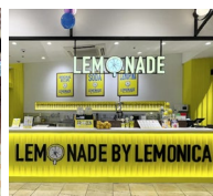
4. LEMONADE by Lemonica 大宮ラクーン