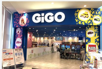
FUN VILLAGE in KASHIWANOHA