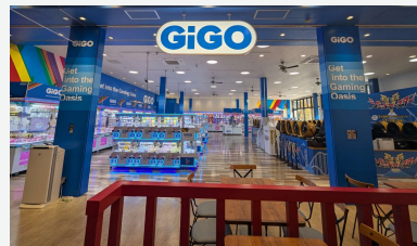
GiGO富士急ハイランド