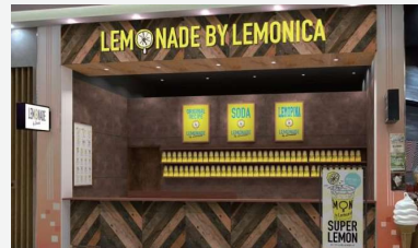
LEMONADE by Lemonicaスマーク伊勢崎

16日、群馬県の大型ショッピングセンター「スマーク伊勢崎」の1階、多数の飲食店が集まるグルメパークに「LEMONADE by Lemonica スマーク伊勢崎店」がオープンしました。独自製法の非加熱シロップを使用した金沢生まれの本格レモネードは買物を楽しまれるお客様にもたいへん好評です。また、同ショッピングセンターの3階には国内最大級の「GiGO」と「FUN VILLAGE」が既に出店しており、今後GiGOと連動した相互送客イベントも企画しています。