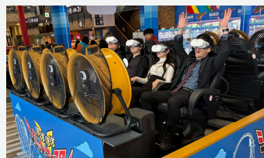
ほぼほぼジェットコースターV

14日、山梨県ではGiGO初出店となる「GiGO富士急ハイランド」と、富士急ハイランドとGENDAのグループ会社である株式会社ダイナモアミューズメントが開発運営するVRアトラクション「ほぼほぼジェットコースターV」が同時にオープンしました。天候に影響されずに楽しめる「ほぼほぼジェットコースターV」は、計画の2倍以上のお客様が並ぶ人気の高さで、GiGOのお店とともに、富士急ハイランドでの新しい思い出づくりに貢献しています。