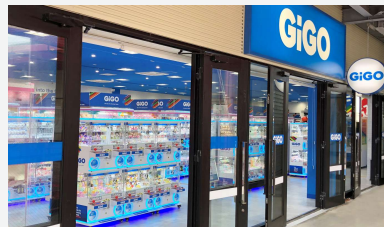
GiGO沖縄アウトレットモールあしびなー

7日、沖縄県2店舗目のGiGOとなる「GiGO沖縄アウトレットモールあしびなー」がオープンしました。那覇空港から車で15分の「沖縄アウトレットモール あしびなー」はインバウンドや観光客の利用が多い日本最南端のアウトレットモールで、同店はクレーンゲームを中心にGiGOでしか入手できない限定景品を多数取り揃えています。オープン後は観光のお客様だけでなく、地域のお客さまも多数来店され、GiGOへの期待の高さがうかがえます。