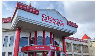
カラオケ時遊館23店舗

1日、株式会社アトムが東北・北関東・東海・北陸地区で運営する「カラオケ時遊館」23店舗が、カラオケBanBanを運営する株式会社シン・コーポレーションに仲間入りしました。これにより双方の人的資源やDXにかかる知見の共有、消耗品等の共同購買による店舗運営効率の向上が期待されると同時に、アミューズメントでの取引網を活用したIPコラボの実施やフード&ビバレッジで展開する飲食物の提供など、新たなサービスを展開することで、新規顧客の集客と、顧客満足度の向上が期待できます。