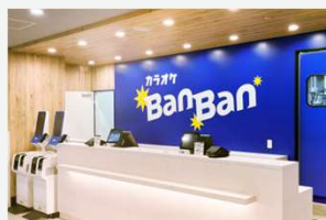
カラオケBanBan立川駅北口本店

1日、東京都立川市では2店舗目となる「カラオケBanBan立川駅北口本店」がオープンしました。立川駅から徒歩3分の好立地に、最新のカラオケ機器を備えた50室に加えてダーツ5台も設置した、カラオケもダーツも楽しめる駅前的大型店舗です。さらに12日には、愛知県名古屋市では4店舗目となる「カラオケBanBan名駅4丁目店」がオープンしました。こちらも名古屋駅から徒歩3分とアクセスが良く、最新のカラオケ機器を備えた35室を完備。お一人からグループまで、様々なシーンで利用いただけるお店です。いずれも「立川駅」「名古屋駅」というターミナル駅から徒歩圏内ということもあり、オープン後は駅を利用される多数のお客様が来店され、賑わっております。