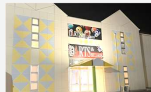
ポイント松江学園店

28日、島根県松江市に、株式会社シン・コーポレーションが運営するダーツ&ビリヤードバーの7店舗目「ポイント松江学園店」がオープンしました。同店から徒歩約3分の場所には「カラオケBanBan松江学園通り店」もあり、個人からグループまで様々な遊び方にご利用いただけるようになりました。オープン後は地域のお客様が多数来店され、手軽に遊べるダーツやビリヤードを楽しまれています。