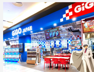
GiGOのたい焼きイオンモールビンタン

25日、ベトナムホーチミン市の「イオンモール ビンタン」2階に「GiGOのたい焼きイオンモール ビンタン」がオープンしました。海外初出店の「GiGOのたい焼き」では、通常の「たい焼き」に加え、キャラクターを活用した「限定コラボたい焼き」を展開。キャラクター物販やドリンクを提供するコラボカフェを併設し、クレーンゲームも18台配置した、日本の推し活を凝縮した店舗です。GiGOならではのキャラクターコラボを通じて、ベトナムのお客様に新たな体験を提供します。