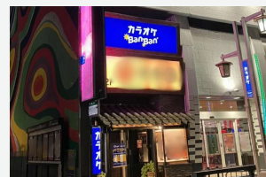
カラオケBanBan名駅4丁目店