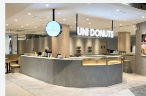
UNI DONUTS イオンモール岡崎

10日、株式会社Sweet Pixelsが、愛知県で4店舗目となる「UNI DONUTS イオンモール岡崎」をオープンしました。イオンモール岡崎は三河エリア最大級の大型商業施設。ファッションからグルメ、映画館まで揃った人気のモールです。横浜発の生ドーナツ専門店「UNI DONUTS (ユニドーナツ)」自慢の“ふわとろ生食感”の生ドーナツは、ショッピングに訪れたお客様にもたいへん好評をいただいています。