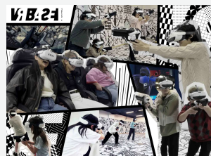
VR BASE TOKYO

19日、福岡・キャナルシティ博多に、株式会社ダイナモアミューズメントと日本XRセンターが共同運営を行うVR施設「VR BASE TOKYO / XR CENTER GAME SPACE 福岡店」がオープン。今年1月～4月に東京タワーで期間限定開催した「VR BASE TOKYO」の常設施設です。グループで対戦可能な大型VRシューティングと3つのVRコンテンツを誰もが気軽に体験できます。リアルなVRの世界でスポーツのように動いたり、絶叫したり、それぞれの楽しみ方ができる話題のスポットとなっています。